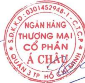
Trần Hùng Huy Chủ tịch Hội đồng Quản trị Ngày 13 tháng 8 năm 2018